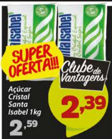
Açúcar Cristal Santa Isabel 1kg