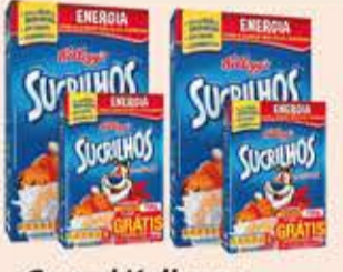
Cereal Kelloggs Sucrilhos 730g + 150g grátis