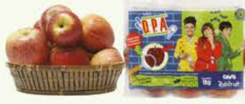
Maçã Detetives do Prédio Azul 1kg