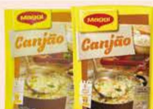
Canjão Maggi 200g