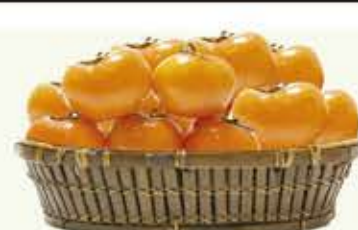
Caqui Rama Forte bandeja/600g