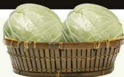
Repolho Verde kg