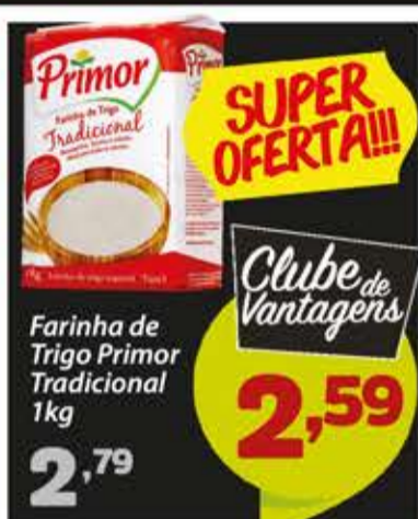
Farinha de Trigo Primor Tradicional 1kg