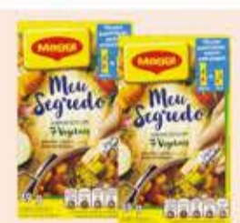
Tempero Maggi Meu Segredo 49g