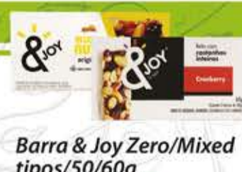
Mini Biscoitos de Arroz Camil Integral 150g