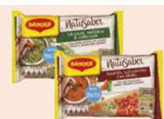
Tempero Maggi Natusabor tipos/ 40g