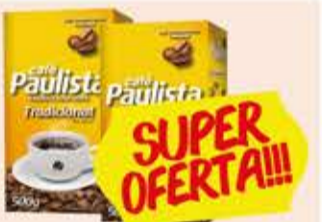
Café em Pó Café Paulista tipos/ vácuo/ 500g