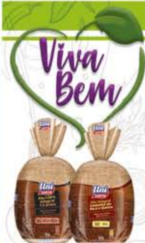
Pão Uni Sabor Integral Castanha do Pará e Quinoa ou 100% Integral 12 Grãos 500g