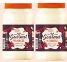
Maionese Cremosa Gourmet PET/500g