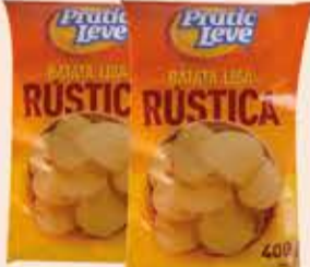
Batata Pratic Leve Lisa Rústica 400g