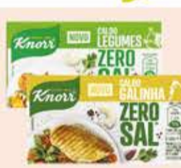
Caldo Knorr Zero Sal tipos/48g