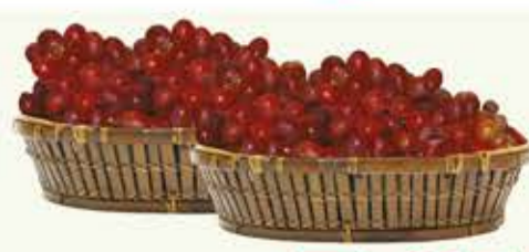
Uva Vermelha 500g