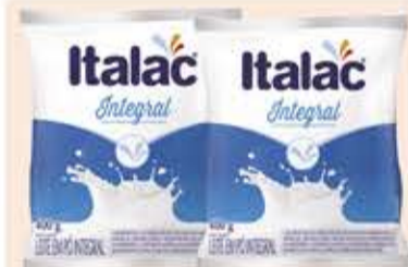
Leite em Pó Italcac sachê 400g