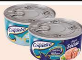
Atum Sólido Coqueiro tipos/170g