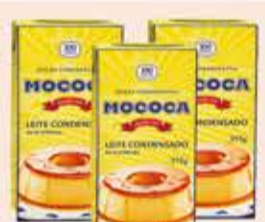
Leite Condensado Mococa TP/395g