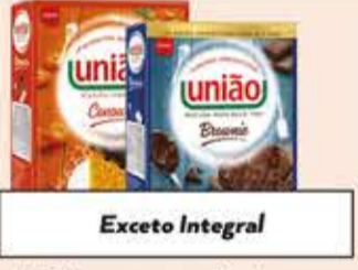
Mistura para Bolo União tipos/ 400g/ 480g