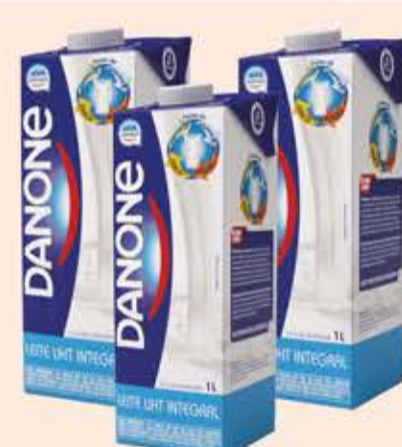
Leite Longa Vida Danone 1L