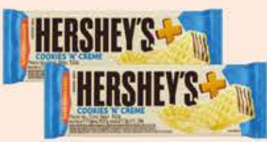
Wafer Hershey's+ tipos/102g