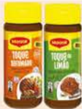
Tempero Maggi Vidro tipos/ 85g/ 95g