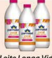
Leite Longa Vida Parmalat Zymil Zero Lactose tipos/ garrafa/ 1L