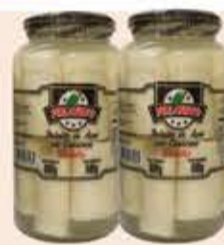
Palmito de Açai Piriquito Tolete 500g