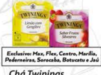
Chá Twinings tipos/15g/18g/20g