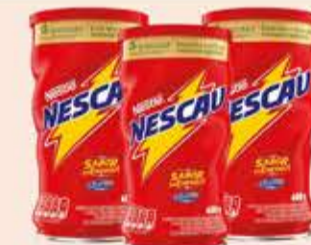
Achocolatado em Pó Nescau 2.0/400g