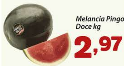
Melancia Pingo Doce kg