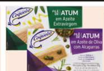
Filé de Atum Coqueiro em Azeites tipos/125g