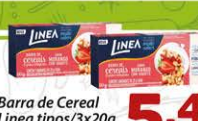
Barra de Cereal Linea tipos/3x20g