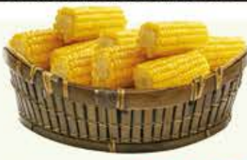
Milho Verde Fernandes bandeja/600g