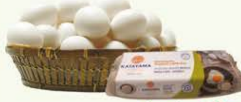
Ovos Katayama Brancos Grandes com 12 unidades