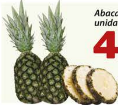
Abacaxi Pérola unidade