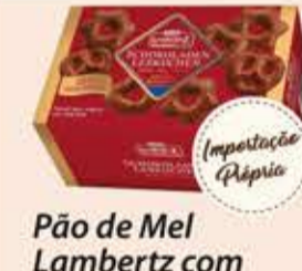
Pão de Mel Lambertz com Cobertura de Chocolate 250g