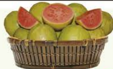
Goiaba Vermelha kg