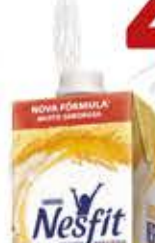
Alimento Nesfit tipos/1L