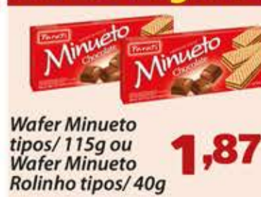
Wafer Minueto tipos/ 115g ou Wafer Minueto Rolinho tipos/ 40g