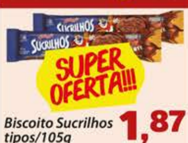
Biscoito Sucrilhos tipos/105g