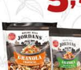
Granola Jordans tipos/400g