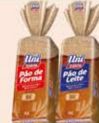
Pão de forma ou de Leite Uni Sabor 450g