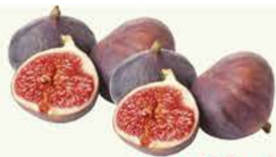
Figo Roxo Mape 300g