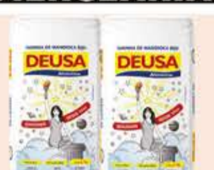
Farinha de Mandioca Deusa Biju 500g