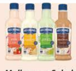
Molho para Salada Hellmann's tipos/210ml