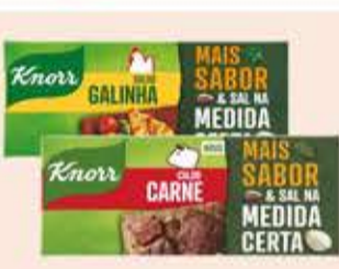
Caldo Knorr tipos/114g