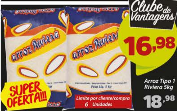
Arroz Tipo 1 Riviera 5kg